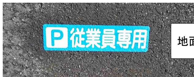
地面のペンキマーク